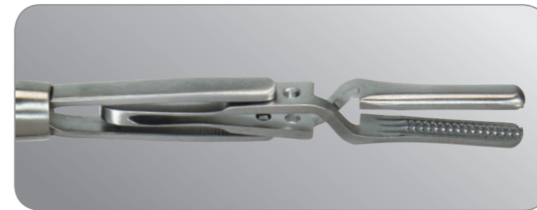
Bulldogklemme in der Fixieraufnahme